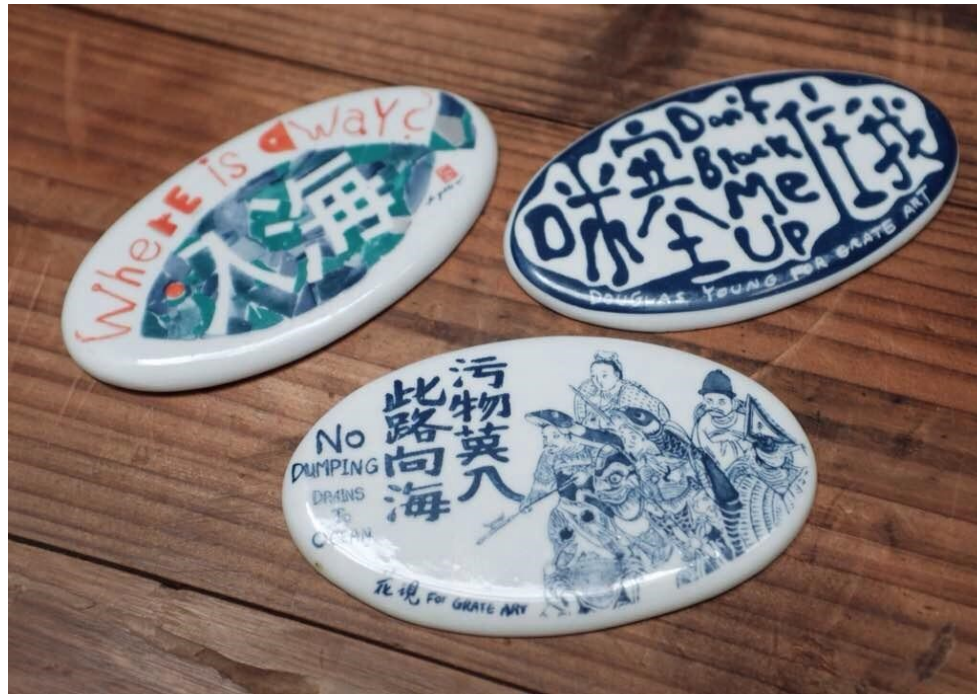
2016 年南區「井柵藝術」的瓷磚樣板