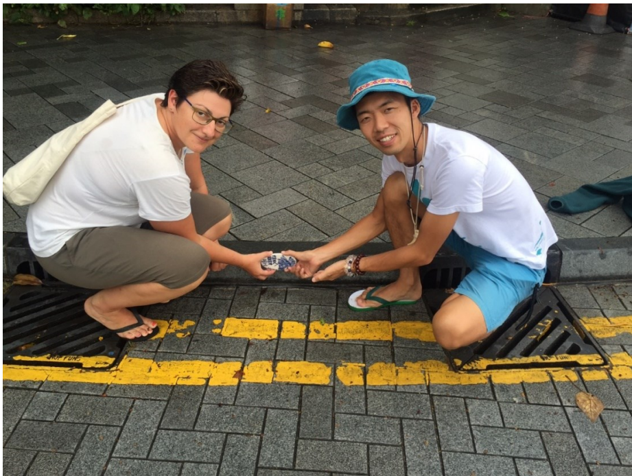
義工們正在於南區安裝「井柵藝術」的瓷磚