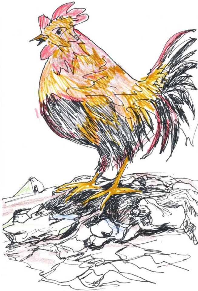
Uncle Roo 公雞叔叔